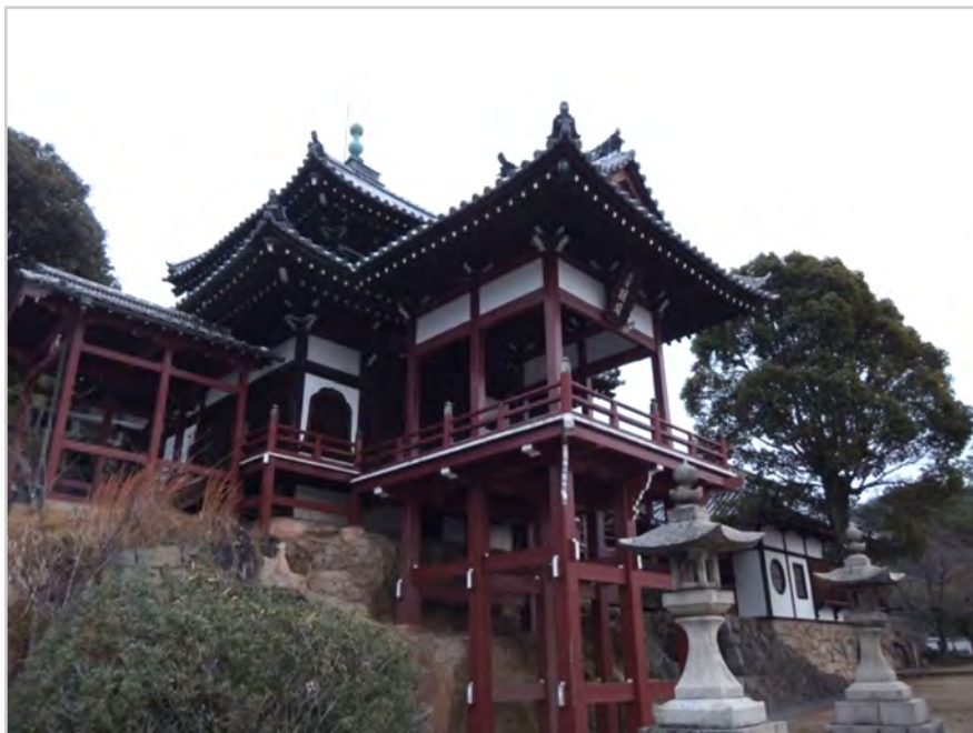
普明閣 京都の清水寺を模した と言われる

竹原は17世紀～20世紀半ば まで製塩業で栄え、その繁栄 は様々な建築に見られる。