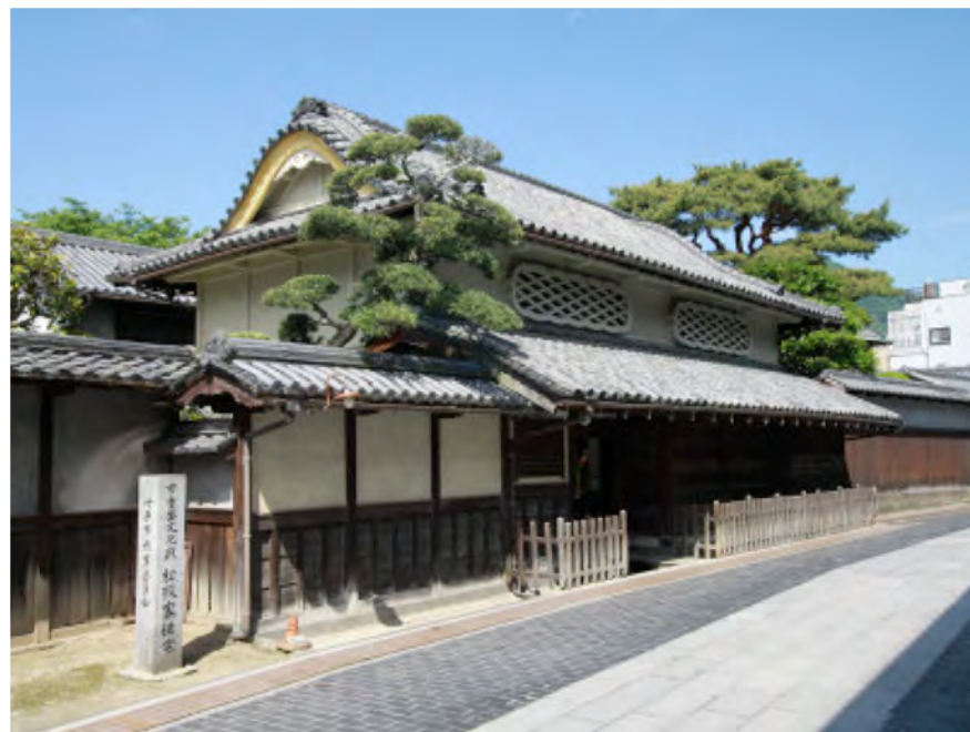
松阪邸 豪商の邸宅

竹原は17世紀～20世紀半ば まで製塩業で栄え、その繁栄 は様々な建築に見られる。