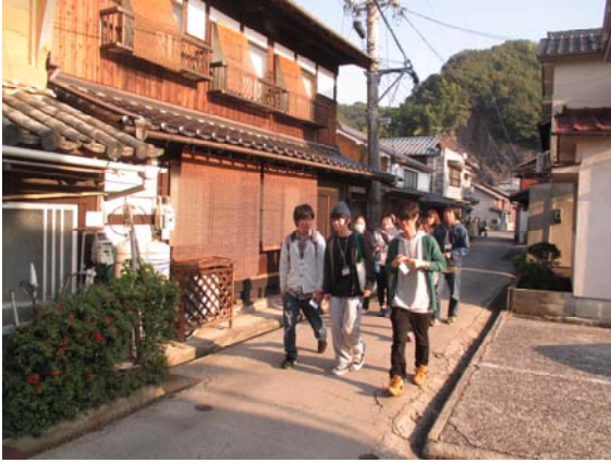
竹原町並み保存地区の見学