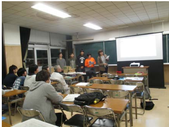
実習生による発表会