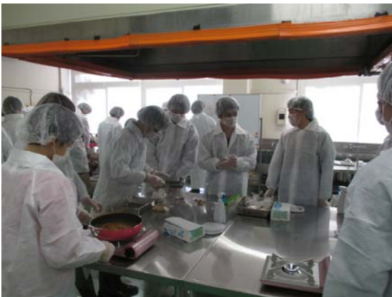
食品加工施設での調理実習