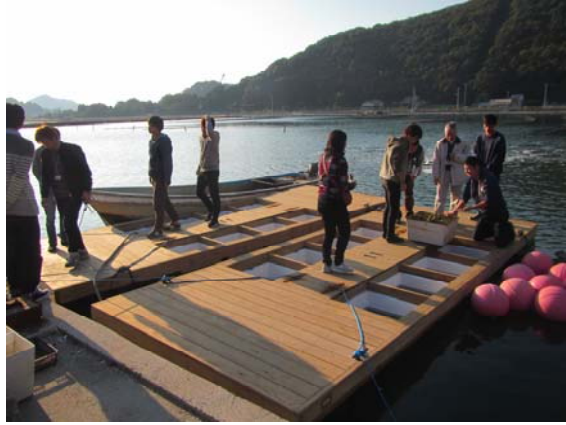
マガキ養殖池の見学