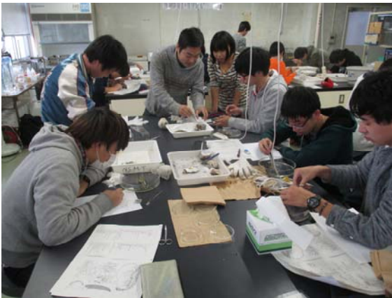
養殖関連生物の観察