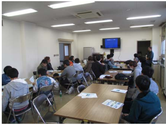
広島県栽培業センターでの講義