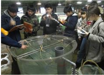
栽培漁業センターでの実習