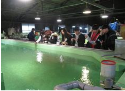
栽培漁業センターでの実習2