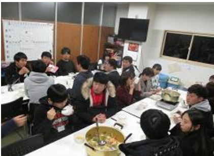
実習中の食事の風景