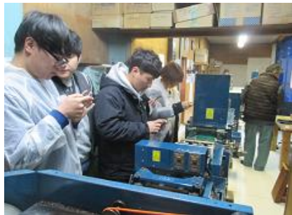
海苔養殖場での実習風景