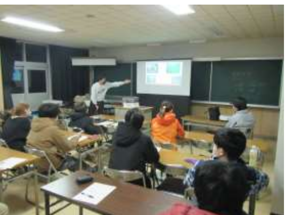
実習生による発表会