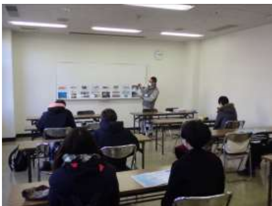
広島県栽培漁業センター での講義