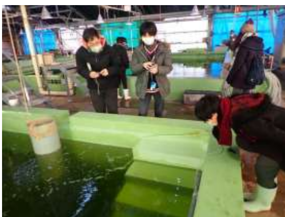
広島県栽培漁業センター の見学