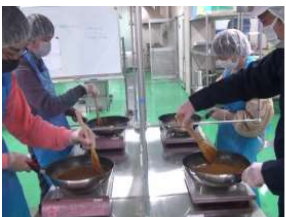
食品加工施設での調理実習