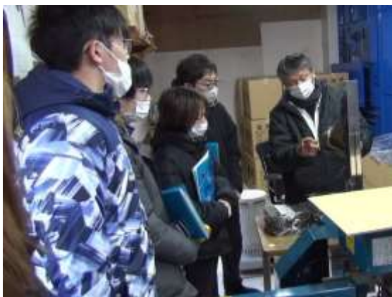
ノリ養殖・加工場見学