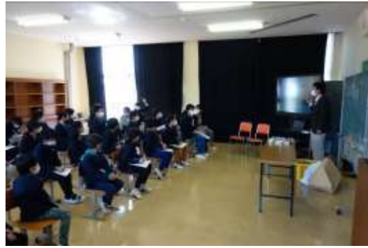
竹原市立東野小学校での出前授業（10月14日）