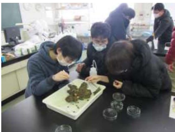
養殖関連生物の観察