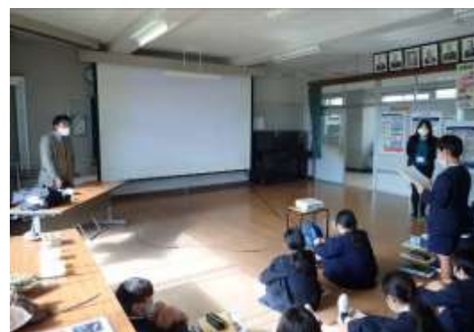
竹原市立竹原西小学校での出前授業（11月26日）