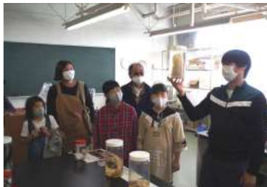
たけはら海の学校（10月25日、11月15日）