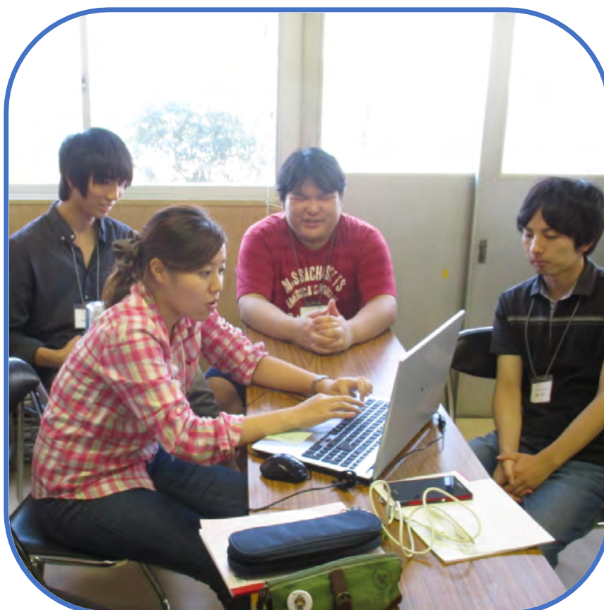
班で発表会の準備中