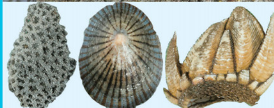
キクメイシモドキ(サンゴ) マツバガイ