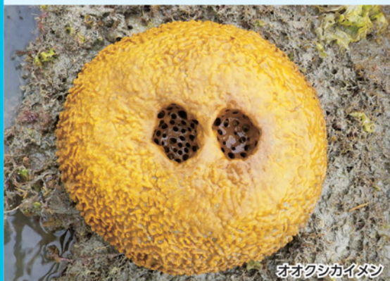
オオクシカイメン