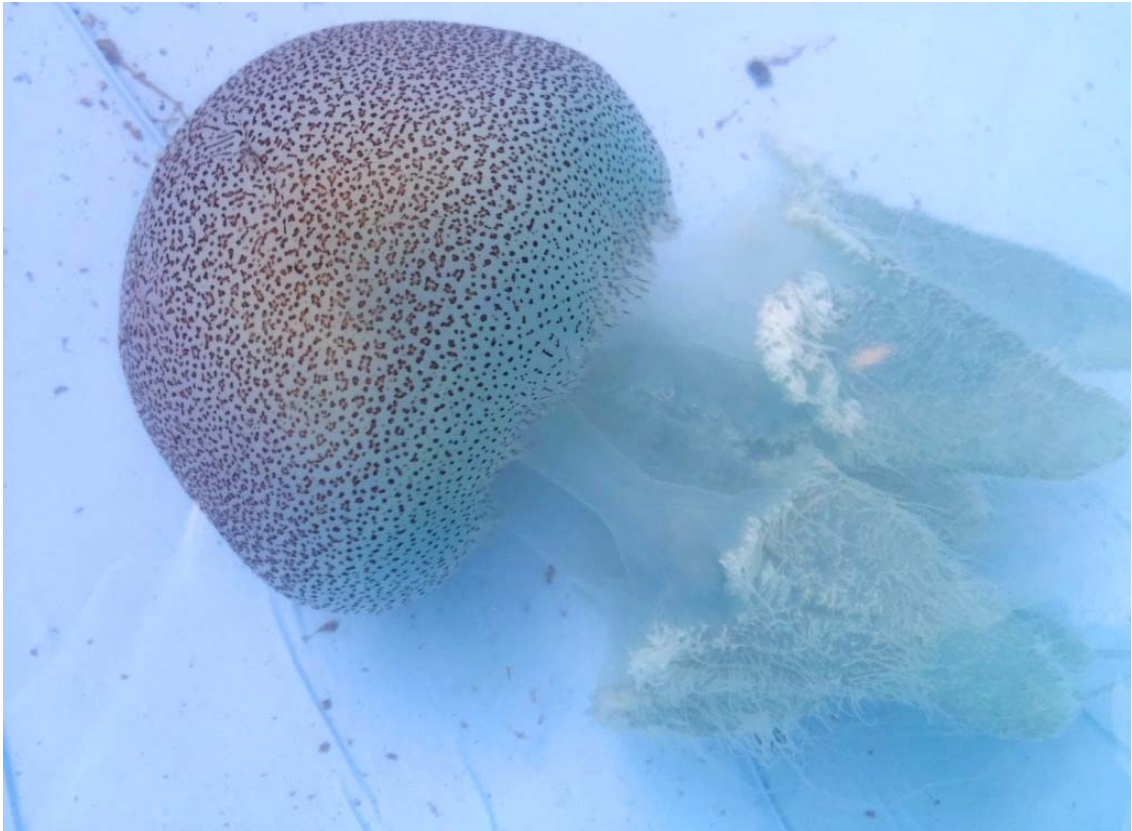
豹柄模様が美しいクラゲである(写真は野生個体)

「ヒョウガライトヒキクラゲ」はフィリピン調査チームの北里アクアリウムラボ・新江ノ島水族館・鶴岡市立加茂水族館の3館にて世界初の展示公開となります。