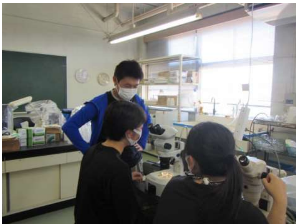
採集したプランクトンを顕微鏡で観察する様子